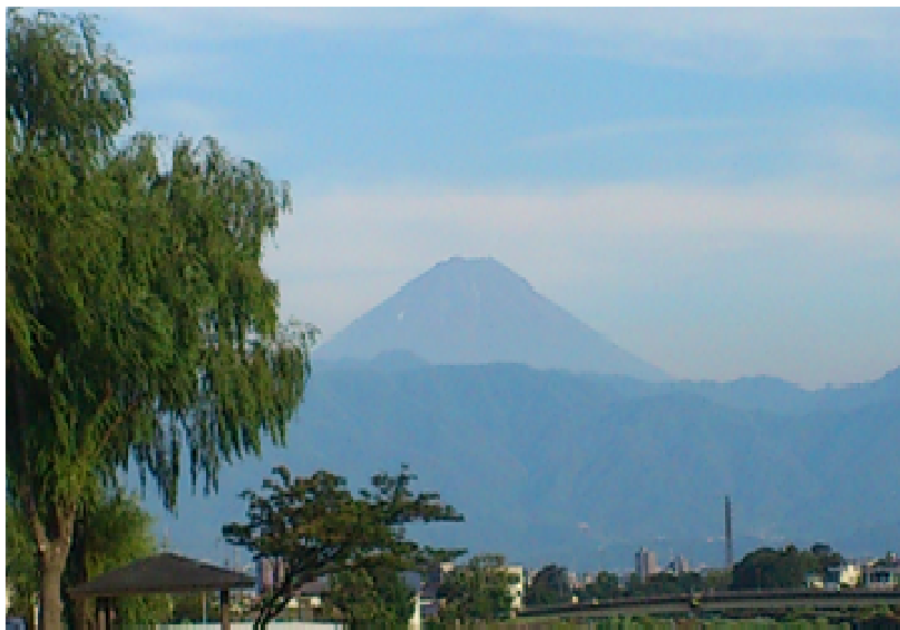
北甲府介護施設から望む富士山