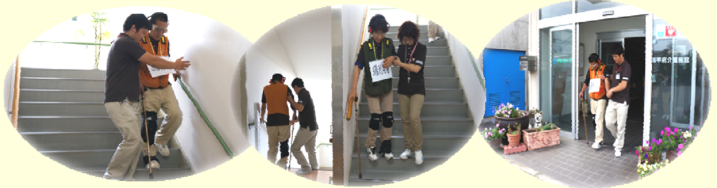
※職員全員参加しての避難風景