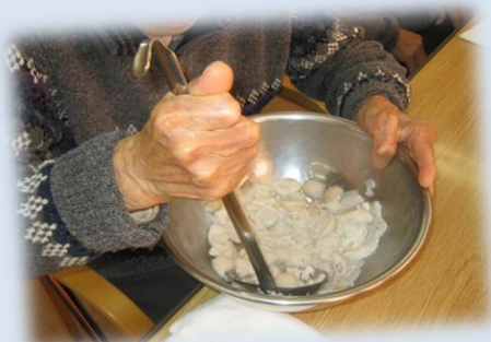
＜里芋をよく潰します！＞