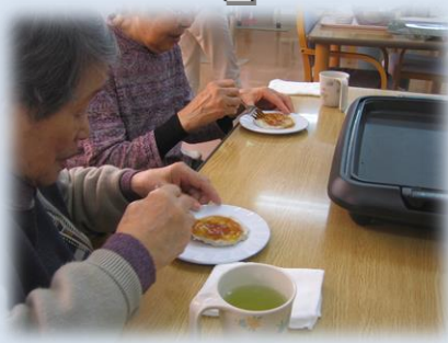
＜皆さんで頂きま～す。＞