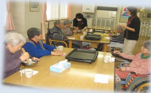
＜おやつ行事の様子＞