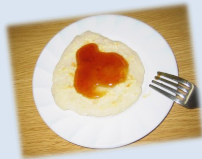
＜みたらしのタレを付けて完成＞