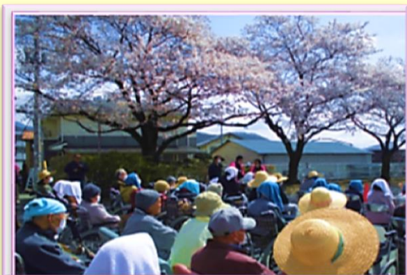
＜昨年の春まつりの様子＞