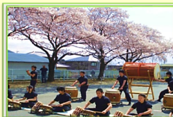
＜韮崎工業高校の太鼓部の皆さん＞