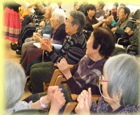
<演目を楽しむご利用者様>