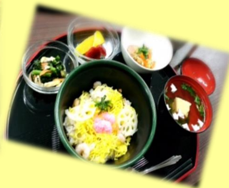
<ひな祭りお祝い膳>

3月3日(火) ひなまつりイベントとして、フォークダンスクラブ「富士桜」の皆様にご訪問して頂きました。職員もご利用者様と一緒に歌って踊って、体も心も軽くなり、とても楽しいひとときを過ごす事が出来ました。