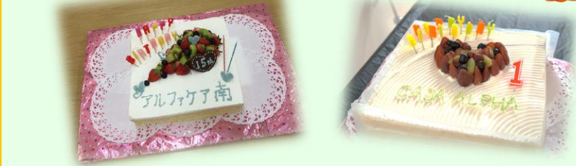
＜2015年 厨房による手作りケーキ作品＞

10月21日(水)におやつ行事にて南瓜のホットケーキ(ハロウィン)作りをしました。生地から混ぜ〜、焼きあがったホットケーキにチョコペンで顔を書きました。食べるのがもったいないという方もいましたが、いつの間にかきれいに召し上がられていました。ご利用者様から「美味しいよ!!」と笑顔で声を掛けて頂き、とても嬉しい気持ちになりました。