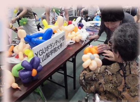
<ボランティア博への見学>

アルファケア北甲府介護施設では様々な行事が行われました。秋の大運動会では、玉入れやパン食い競争。秋の炭焼き祭りでは旬の野菜を食べたり、外出レクなど皆さま笑顔が溢れ楽しんでくださいました。これから寒くなりますが、クリスマスや年末の行事など企画しておりますので風邪や体調には気を付けて楽しみに待っていてください。