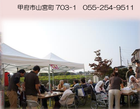
<秋の炭火焼き祭りの様子>