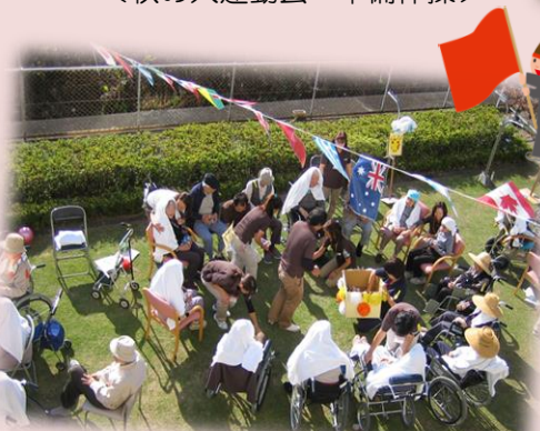
<秋の大運動会 競技の様子>