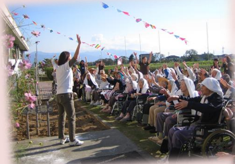
<秋の大運動会 準備体操>