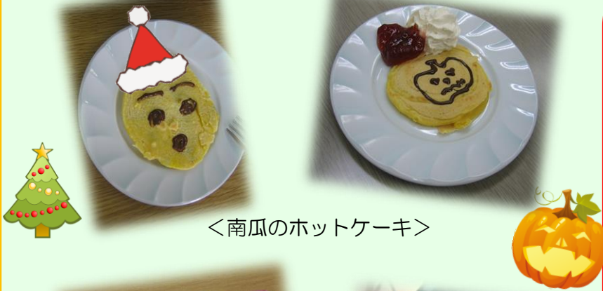
＜南瓜のホットケーキ＞