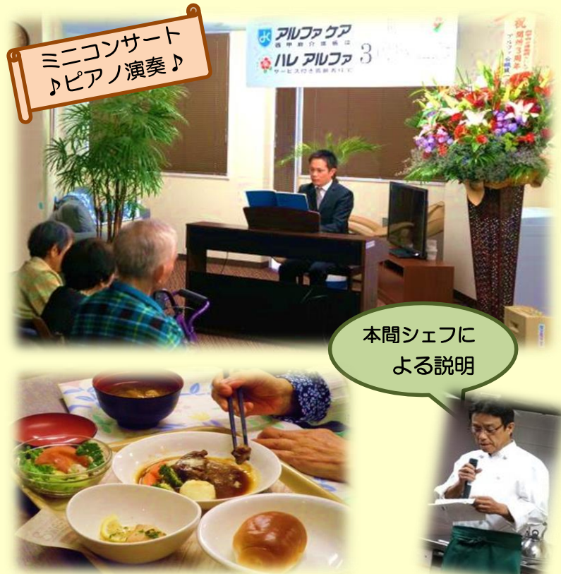
ミニコンサート ♪ピアノ演奏♪