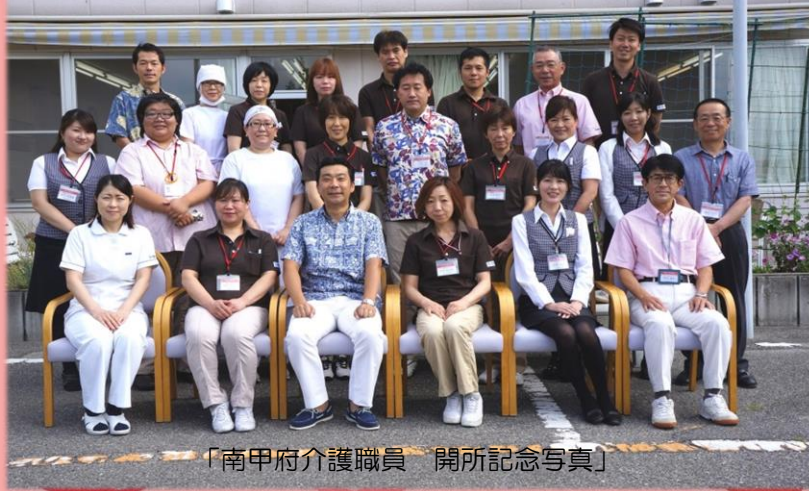
「南甲府介護職員 開所記念写真」

明けましておめでとうございます。本年もご利用者様が安全で安心した生活を送って頂けるよう職員一同より良いサービスの提供に努めさせていただきます。新しい一年が幸多き年でありますように・・・本年もよろしくお願い致します。アルファケア南甲府職員一同 <編集 看護>