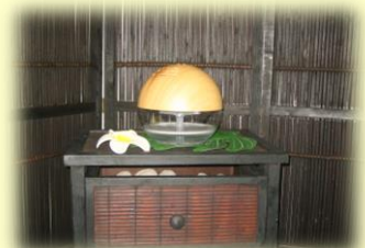
<リラクゼーションルーム>