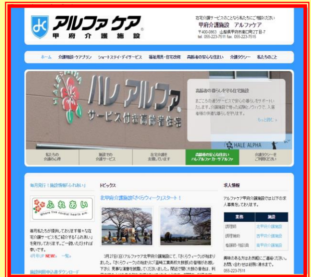
< ホームページ トップページ >