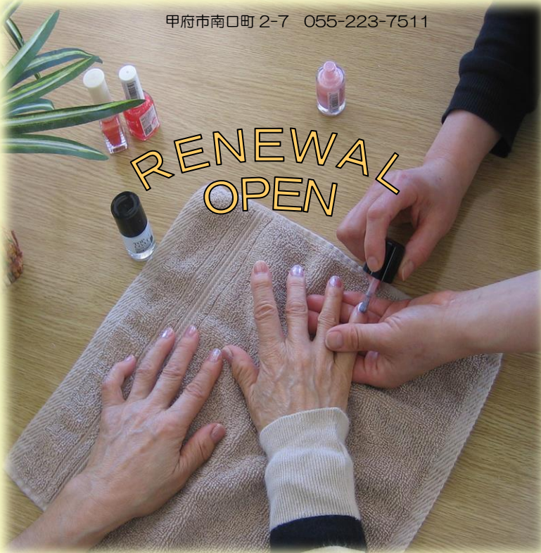
<ハンドケアセラピストによるネイルケアの様子>

アルファケア南甲府介護施設 デイサービスでは、平成 28 年 4 月より リラクゼーション型デイサービス として リニューアルいたしました。