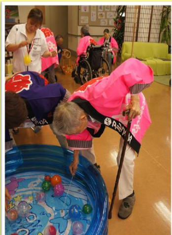
ヨーヨー釣りの様子！