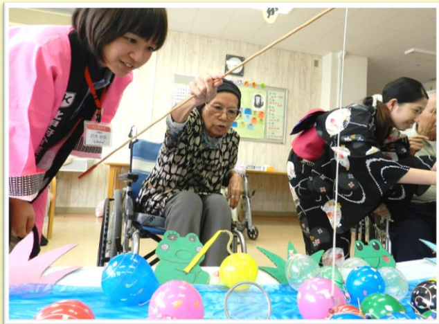
夏祭り（ヨーヨー釣り）の様子！