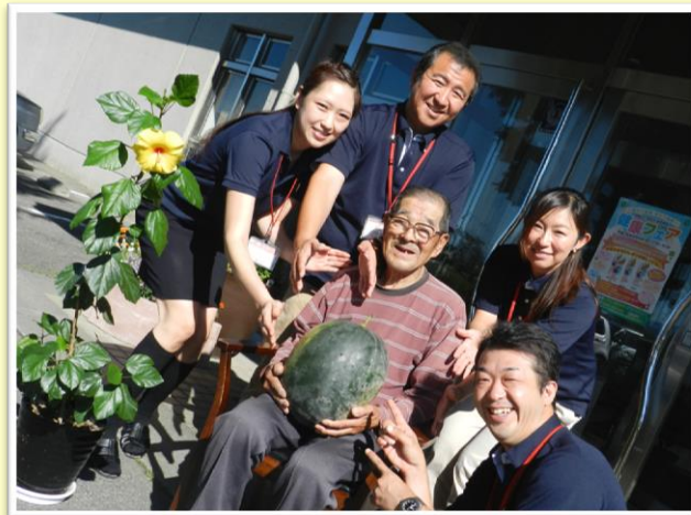
朝採りのスイカと、記念撮影♪

カーサアルファにお住まいの方が毎朝畑に出かけて、丹精込めて育てられた自家農園スイカを、入居者様、職員、みんなでごちそうになりました！とても実が詰まっています、甘くてジューシーなスイカでした。今年も厳しい夏でしたが、夏祭りなどのイベントで、みんなで楽しく暑い夏を乗り切っていきます。