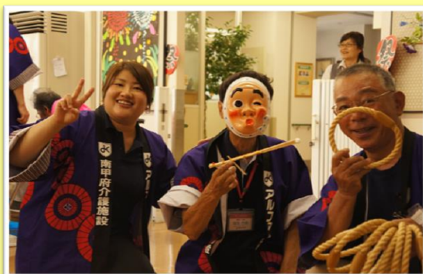
職員も楽しんでいます！