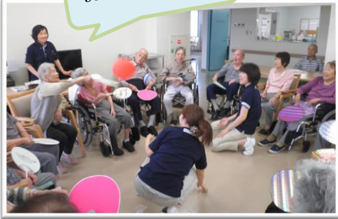
風船バレーの様子 目標100回 落とさず頑張ります!