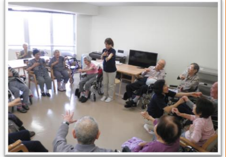
リズム体操 1 2 3・・・♪

9月に入りましたが残暑が続いています。体のだるさはありませんか?アルファケアでは毎日 午後2時からアクティビティを行っています。体操・歌・脳トレ・ゲームなど様々なメニューを担当職員が考えています。是非遊びに来てご覧ください。 編集<看護>