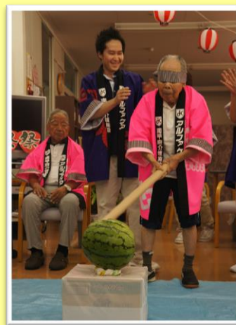
スイカ割りの様子！