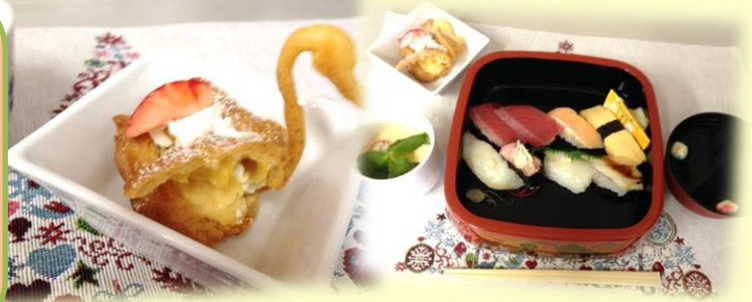
<スワンシュークリームとお祝い膳！>